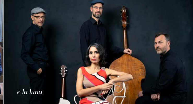
e la luna