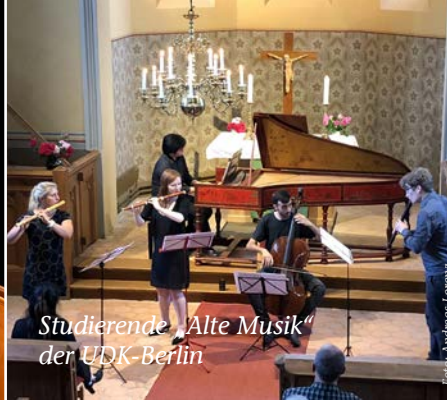
Studierende „Alte Musik“ der UDK-Berlin