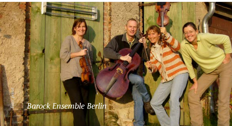
Barock Ensemble Berlin